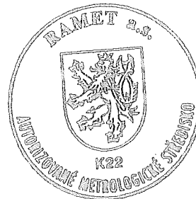
razítko AMS K22