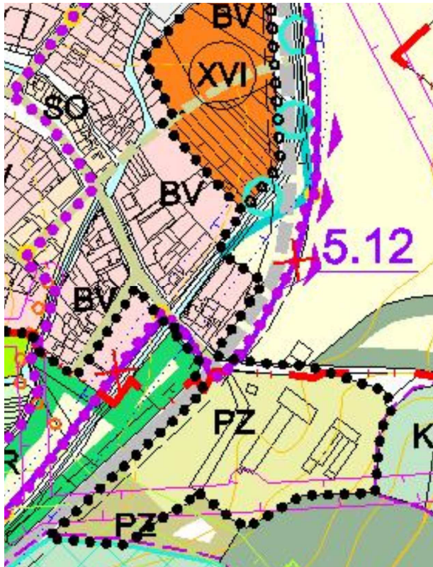
Platný územní plán města Šlapanice/výřez ul. Hlavní, obchvat Bedřichovice