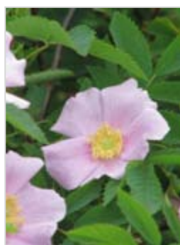
Vlevo růže bedrníkolistá