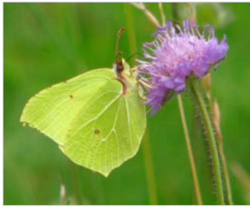
Bělásek zelný Pieris brassicae