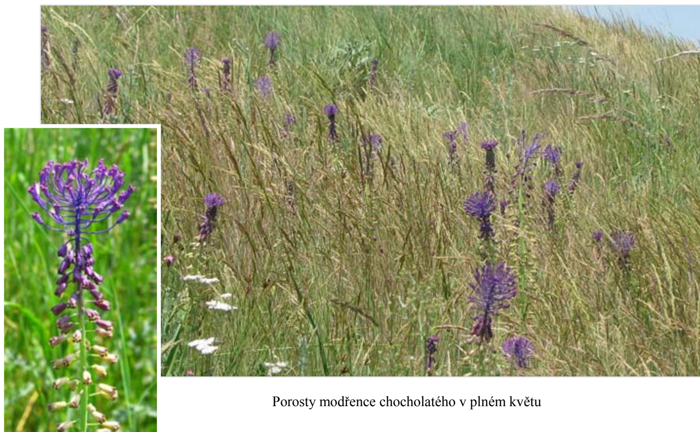
Porosty modřence chocholátého v plném květu