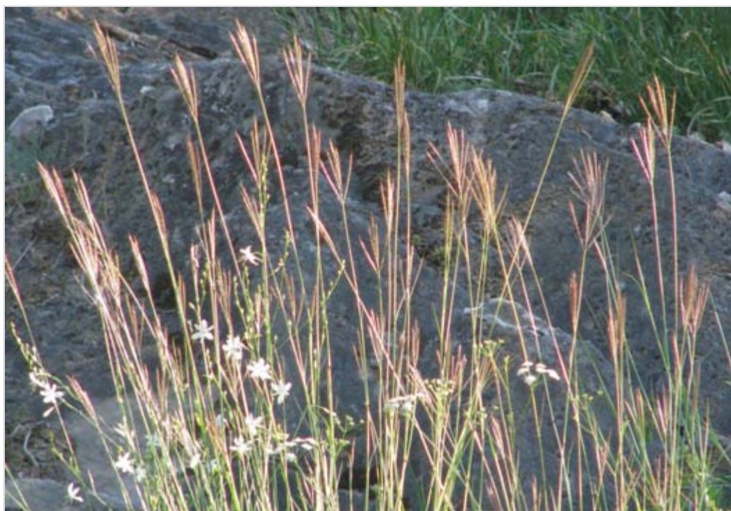
Díky rozestálým lichoklasům patří stepní vousatka prstnatá k atraktivním druhům trav.

Stejně jako česnek ťlutý je statný až metr vysoký sesel sivý dalším charakteristickým druhem zdejší teplomilné květeny.