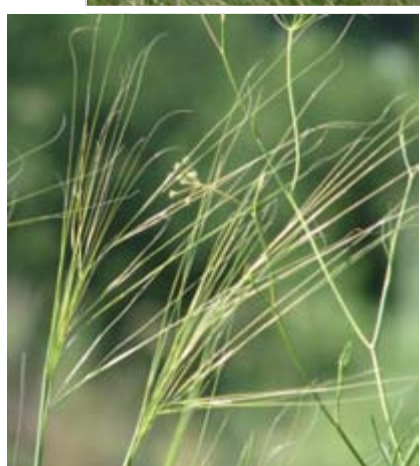
Lesknoucí se jemné kavylové porosty se neobyčejně působivě vlní ve větru