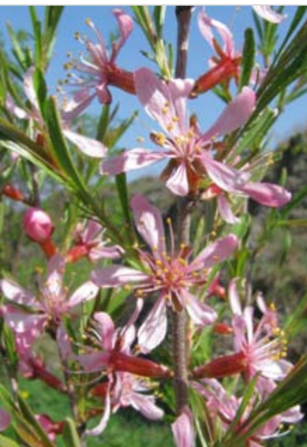
Kvetoucí dřín obecný