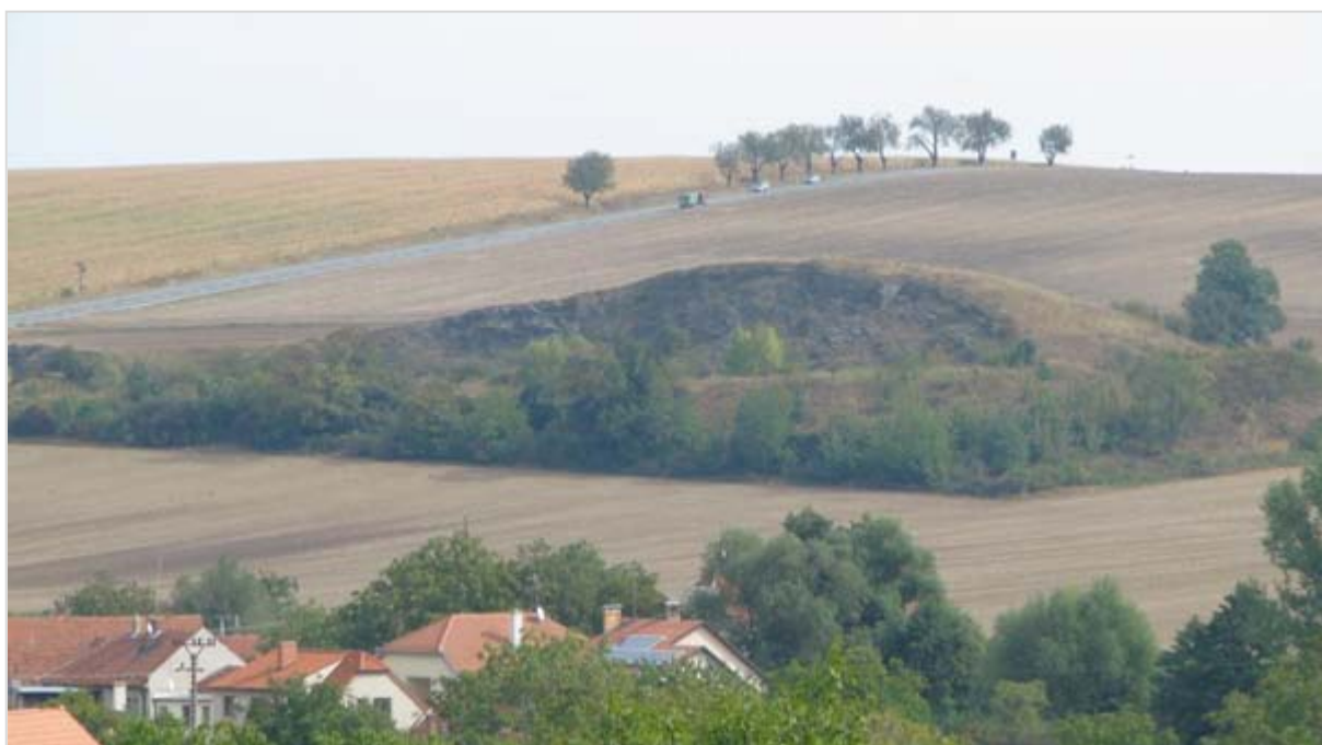
Pohled od západu, v popředí domky v Bedřichovicích

V roce 1953 byl hlavní pahorek už delší dobu odtěžen. Vegetační kryt byl tvořen rozsáhlými travnatými a skalnatými ladi s jen sporadicky roztroušenými dřevinami – hlavně keři. Zastoupení dřevin bylo minimální i na izolovaném pahorku, který byl snad ještě využíván ke kosení nebo vypásání. Podmínky pro rozvoj teplomilných společenstev byly ideální. Plošina pod skalní stěnou byla v následujících desetiletích využívána jako drůbežárna, divoká skládka nebo stavební dvůr v souvislosti s údržbou a výstavbou silničních komunikací. V roce 1992 již byla především terasa pod skalnatou stěnou bývalého kamenolomu mimořádně degradována. Nejen dlouhodobým ukládáním odpadu, ale také samovolným šířením ruderalní vegetace s vysokým zastoupením v minulosti vysazených cizorodých dřevin. Akátu ( Robinia pseudoacacia ), javoru jasanolistého ( Acer negundo ), šeríku obecného ( Syringa vulgaris ), pámelníku bílého ( Symphoricarpos rivularis ) nebo kustovnice cizí ( Lyceum barbarum ). Dřeviny se šířily do dalších částí území. Rekonstrukční zásahy byly nezbytné. V letech 1995-1997 proběhla v této nejvíce postižené části území rozsáhlá rekonstrukce spočívající v odstranění cizorodých dřevin a rekultivaci terasy. Od roku 2000 je prováděna pravidelná údržba zrekultivované terasy opakovaným kosením. V území byly samozřejmě sys-