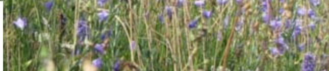
Kvetoucí porosty rozrazilu klasnatého

Během druhé poloviny července dochází k vrcholu rozkvětu pomístních porostů zvonku moravského ( Campanula moravica ) a rozrazilu klasnatého ( Pseudolysimachion spicatum ). Začátkem srpna vrcholí rozkvět bohatých porostů kavylu vláskovitého a začíná rozkvétat zlatovlásek obecný ( Aster linosyris ). Jeho rozkvět pak vrcholí v polovině měsíce, kdy ve vrcholových partiích pahorku začínají rozkvétat i charakteristické „kotrče“ pelyňku ladního ( Artemisia campestris ). Z porostů se definitivně vytrácí barvy, rychle žloutnou a šednou. Vegetační sezóna je u konce.