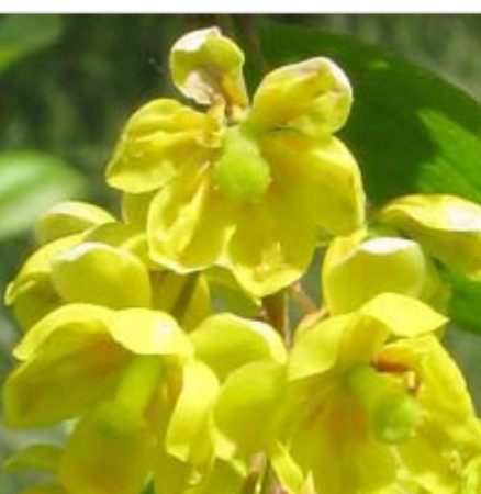
Plody kaliny tušalaje