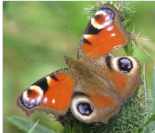
Babočka kopřivová Aglais urticae