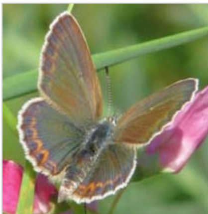
Těťko vybrat toho nejkrásnějšího. Snad modráška černolemého ( Plebejus argus )

Nová louka se stala během posledních deseti let cennou lokalitou denních motýlů. Především více druhů drobných modrásců. Je otázkou, zda zde trvale přeživaly, ale spíše se sem dostali z okolí. Život drobných modrásků je nejen pestrý v souvislosti s velkým počtem druhů, ale také fascinující v souvislosti s jejich závislostí na mravencích (myrmekofilii). Jednotlivé druhy jsou totiž do větší nebo menší míry závislé na soužití s mravenci. Ti housenkám modrásků nejen že neublíží, ale dokonce je chrání (někdy si je přímo chovají), případně jim umožňují kuklení přímo ve svých hnízdech. Housenky jim za to poskytují „odměnu“ ve formě sladkých a na bílkoviny bohatých šťáv. Hlavní místa jejich rozmnožování jsou v rámci kosení v terase prostorově i termínově zohledňována.