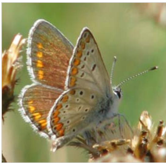
Modrásek jehlicový Polyommatus icarus