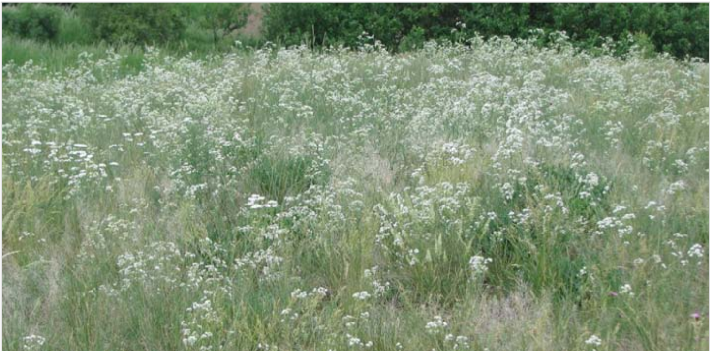
Porosty svízele sivého

Kolem poloviny května ožívají porosty četné nápadně žlutě kvetoucí přízemní keříky čilimníku poléhavého ( Cytisus procumbens ). Koncem května opanují nemalé plochy bílá květenství statného svízele sivého ( Galium glaucum ) a masově kvetou trávy. Během první poloviny června postupně sílí rozkvět kopretiny okoličnaté ( Pyrethrum corymbosum ), modřence chocholatého ( Muscari comosum ), silenky ušnice ( Silene otites ) nebo kozince vičencovitého ( Astragalus onobrychis ).