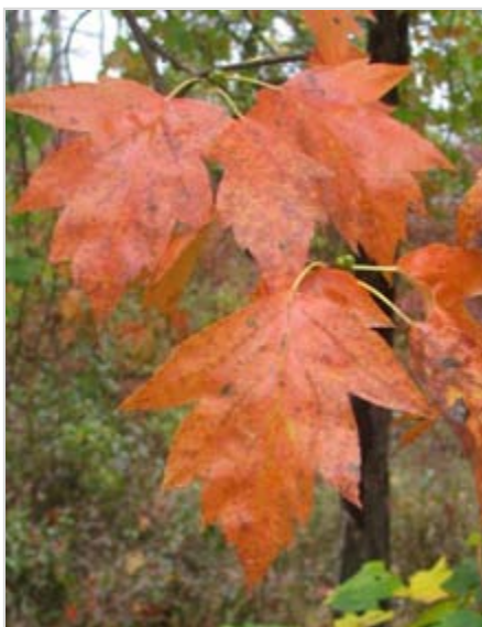
Podzimní list oskeruše domácí