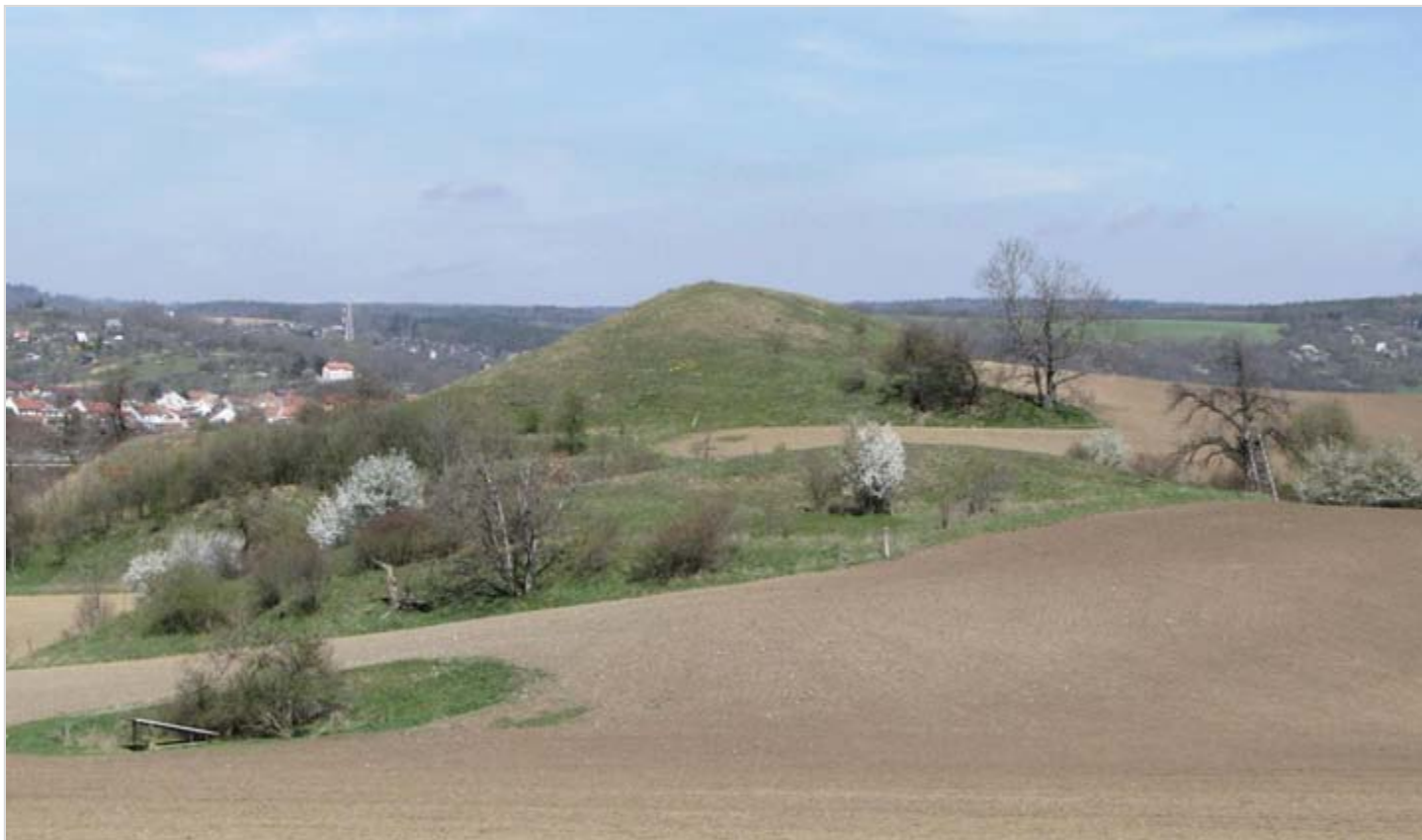
Pohled od jihu, v pozadí vlevo obec Podolí

Kromě dále uváděných dřevin se v území vyskytují další druhy keřů: svída krvavá ( Swida sanguinea ), brslen evropský ( Euonymus europaeus ), růže šípková ( Rosa canina ), hloh obecný ( Crataegus laevigata ), trnka obecná ( Prunus spinosa ) nebo řešetlák počistivý ( Rhamnus catharticus ) a také některé druhy stromů: dub ( Quercus sp.), lípa ( Tilia sp.), morušovník ( Morus sp.), hrušeň obecná ( Pyrus communis ), jasan ztepilý ( Fraxinus excelsior ), třešeň ptačí ( Cerasus avium ), švestka domácí ( Prunus domestica ) nebo slivoň obecná ( Prunus institia ).