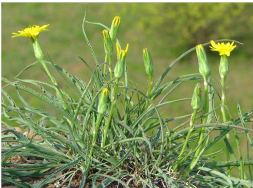
Hadí mord rakouský

Zvonek sibiřský je dvouletou bylinou, která jeden až několik let po vyklíčení přežívá ve formě přizemní růžice. Až po nashromáždění dostatečného množství zásobník látek vykvétá a po dozrání semen celá rostlina zaniká.