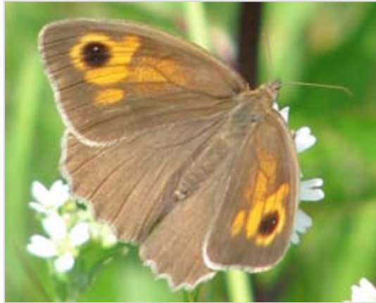
Okáč poháňkový Coenonympha pamphilus