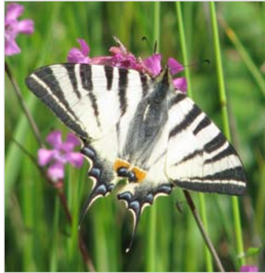
Perlet'ovec malý Issoria lathonia