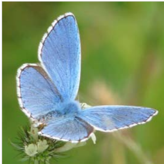
Modrásek štírovníkový Cupido argiades