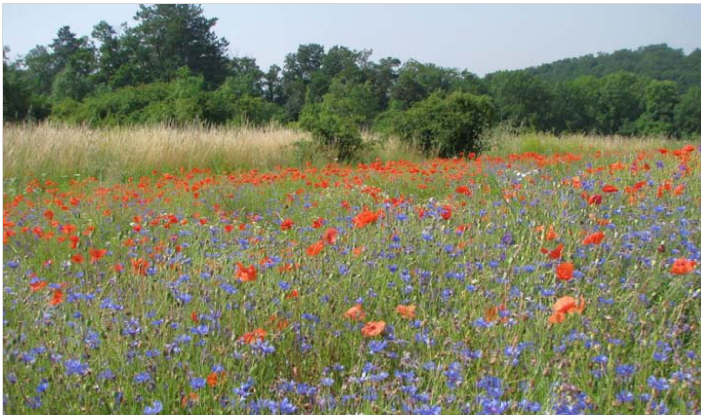
Bohaté porosty máku vlčího ( Papaver rhoeas ) a chrpy polní ( Centaurea cyanus ) na nedávno obdělávaném polním úhoru u Velatic.

Nejenom ve zvláště chráněných územích nebo významných krajinných prvcích, ale i na řadě dalších míst lze dodnes na Šlapanicku nacházet od jara do léta pestře zbarvené kvetoucí travobylinné porosty. Mnohde i s těmi aktuálně nejohroženějšími druhy. K takovým dnes bezesporu náleží skupina tzv. polních plevelů (segetální – obilní flóra). Jde o planě rostoucí rostliny vyskytující se především v polních kulturách, tedy v pravidelně mechanicky obdělávaných plochách. Značná část polních plevelů není v našich krajích původní, ale během lidské historie se k nám rozšířila společně