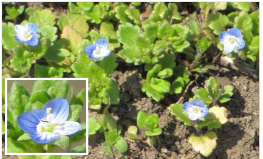
Rozrazil polní ( Veronica agrestis )