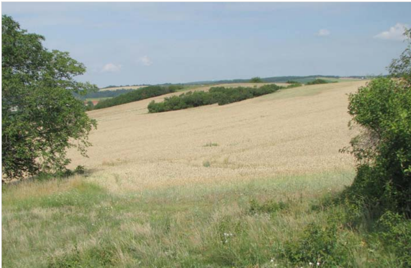
V popředí okraj VKP Podsedky se vzácnými polními plevely, v pozadí uprostřed polí PP Vinohrady.

V souvislosti s výskytem vzácných polních plevelů je třeba za mimořádně významné území považovat okolí Velatic. Pozornost je třeba věnovat především okrajům polí. Nejenom drobných extenzivně využívaných políček, ale i rozlehlým intenzivně obhospodařovaným polním lánům. Jako ideální okraj pole lze v tomto směru považovat plochy podél tradičních druhově pestrých teplomilných trávníků, místa s extrémními půdními podmínkami s jen omezeným mezernatým růstem plodin nebo místa bez soustředování dešťových vod z okolních spádových ploch.