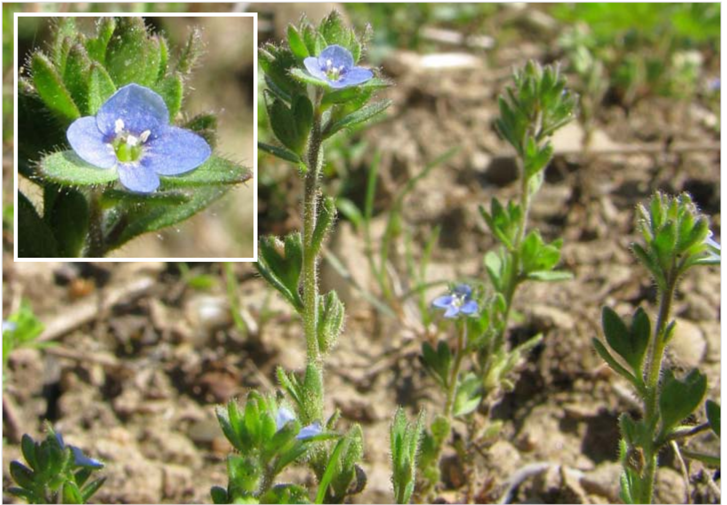
Rozrazil Dilleniův ( Veronica dillenii )