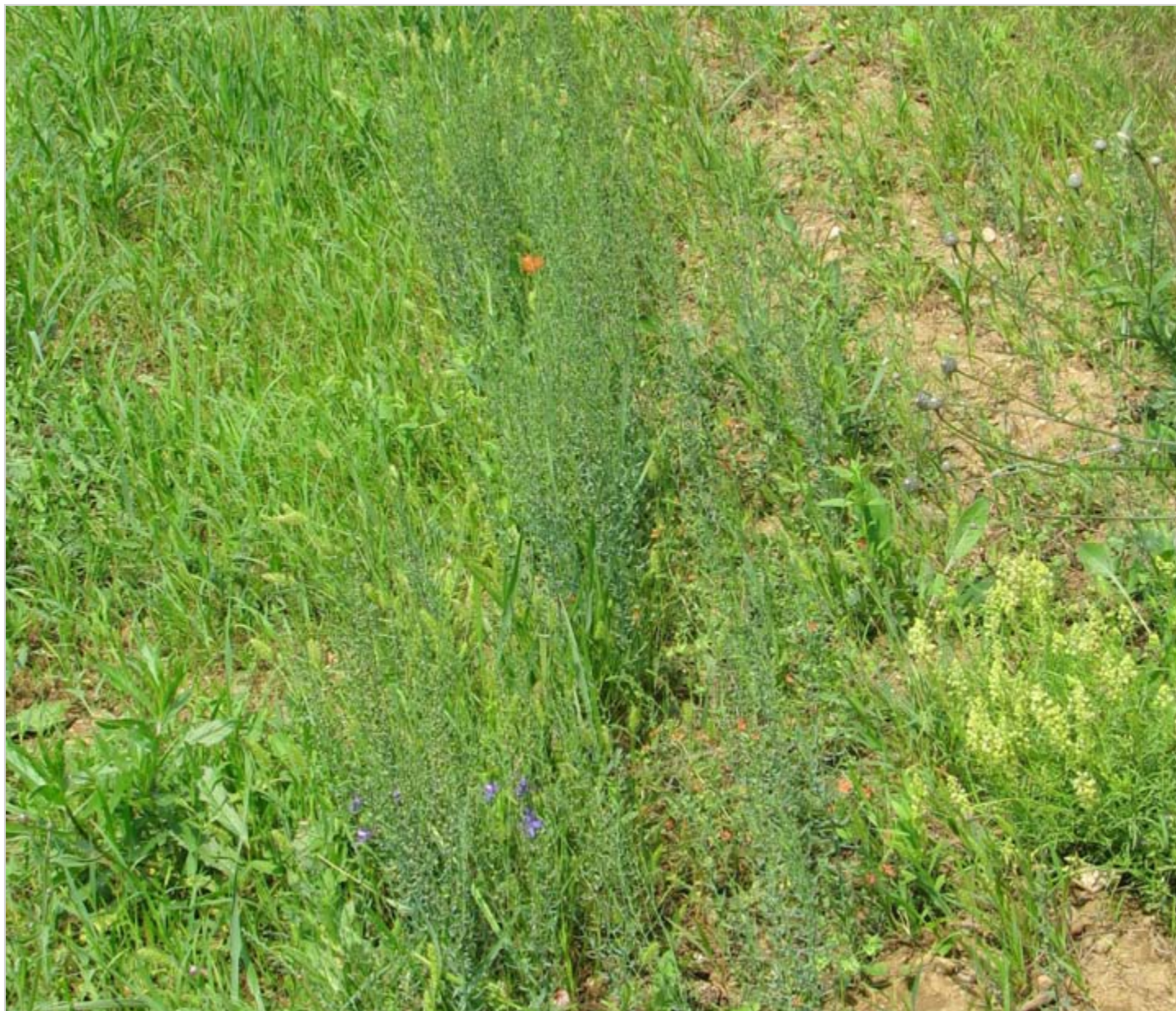
Bohatý porost Thymelaea passerina v okraji pole pod Vinohradem severozápadně od Tvarožné.

Společenstvům polních plevelů včetně řady více nebo méně ohrožených druhů není stále věnována dostatečná pozornost. Jejich ochrana je samozřejmě již z jejich podstaty problematická a žádný z dotčených druhů není zařazen mezi druhy zvláště chráněné. Na druhé straně by ale jistě nebylo příliš složité či nákladné pro zajištění jejich trvalého přežívání něco udělat. V řadě případů jde o druhy zajímavé svojí stavbou nebo atraktivně kvetoucí. Ohrožené druhy polních plevelů navíc nepatří k těm rostlinným druhům, které působí v polních kulturách zemědělcům problémy. Ty jsou způsobovány zpravidla relativně nedávno na naše území zavlečenými tzv. invazními druhy rostlin. Nejsou zapotřebí žádné velké plochy. Plně by mnohde postačovalo ponechávat k tomuto účelů pouze dva až tři metry široké a několik desítek metrů dlouhé okrajové pásy polí. Samozřejmě v předem vytipovaných místech, ve kterých ohrožené druhy stále ještě přežívají. Takto vymezené pásy by měly být průběžně (případně ve dvouletých intervalech) nadále mechanicky obdělávány, ale nemělo by v nich docházet k výsevům nebo aplikacím agrochemikálií.