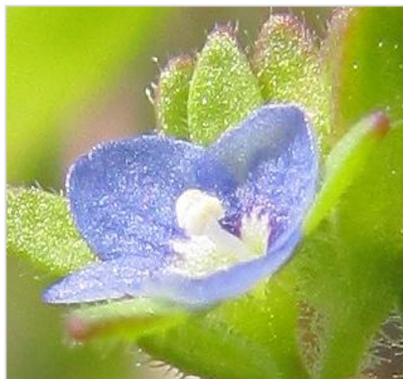
Rozrazil rolní ( Veronica arvensis )