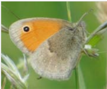
Okáč bojínkový Okáč poháňkový Okáč pýrový