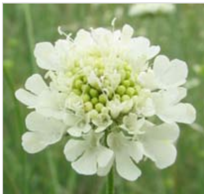
Hlaváč bledavý ( Scabiosa ochroleuca )