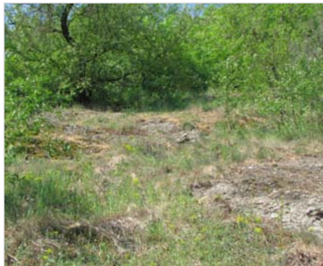
Řešetlák počistivý Ptačí zob obecný