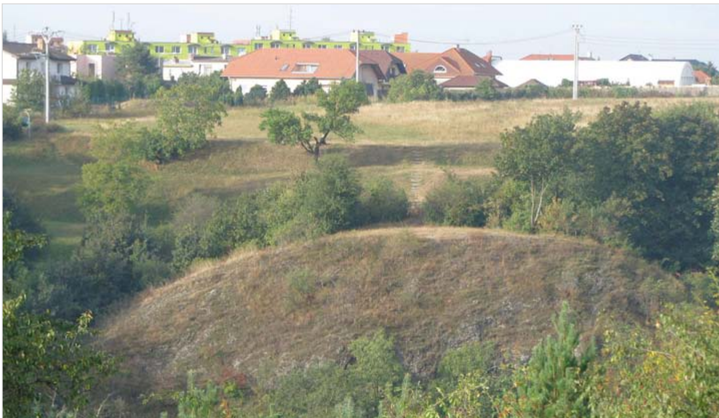
Pohled na Andělku z protějšího svahu údolí Řičky (od východu)

Přírodní památka Andělka a Čertovka byla vyhlášena v roce 1984. Do soustavy evropsky významných lokalit NATURA 2000 byla zařazena jako EVL CZ 0620051 „Slapanické slepence“ společně se třemi dalšími nedalekými přírodními památkami (Horka, Velký hájek a Návrší) s cílem ochrany stanovišť: vápnitých nebo bazických skalních trávníků Alyso – Sedion albi a subpanonských stepních trávníků.