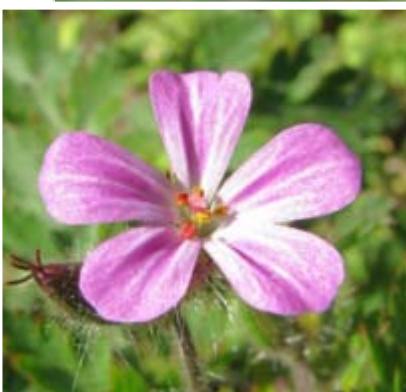
Kakost smrdutý ( Geranium robertianum )