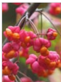
Brslen evropský (dvě levé foto) Hloh (dvě pravé foto)

Bylinné patro je zde značně degradováno. V nižších partiích mimo jiné s bujnými porosty kuklíku městského ( Geum urbanum ), vlaštovičníku většího ( Chelidonium majus ) či cizorodé netýkavky malokvěté ( Impatiens parviflora ). Na druhé straně zde lze sledovat alespoň pomístní proměny tohoto patra ve prospěch kvalitnějších druhů. Například porosty kokoříků ( Polygonatum sp.) se mnohde rychle posunují nahoru nad pěšinu.