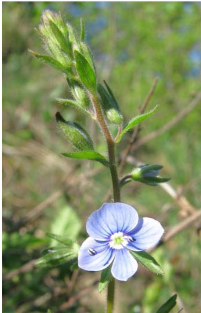
Rozrazil vídeňský ( Veronica vindobonensis )