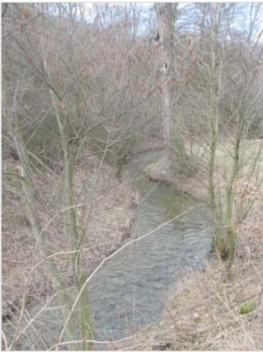
Nad silničním mostkem