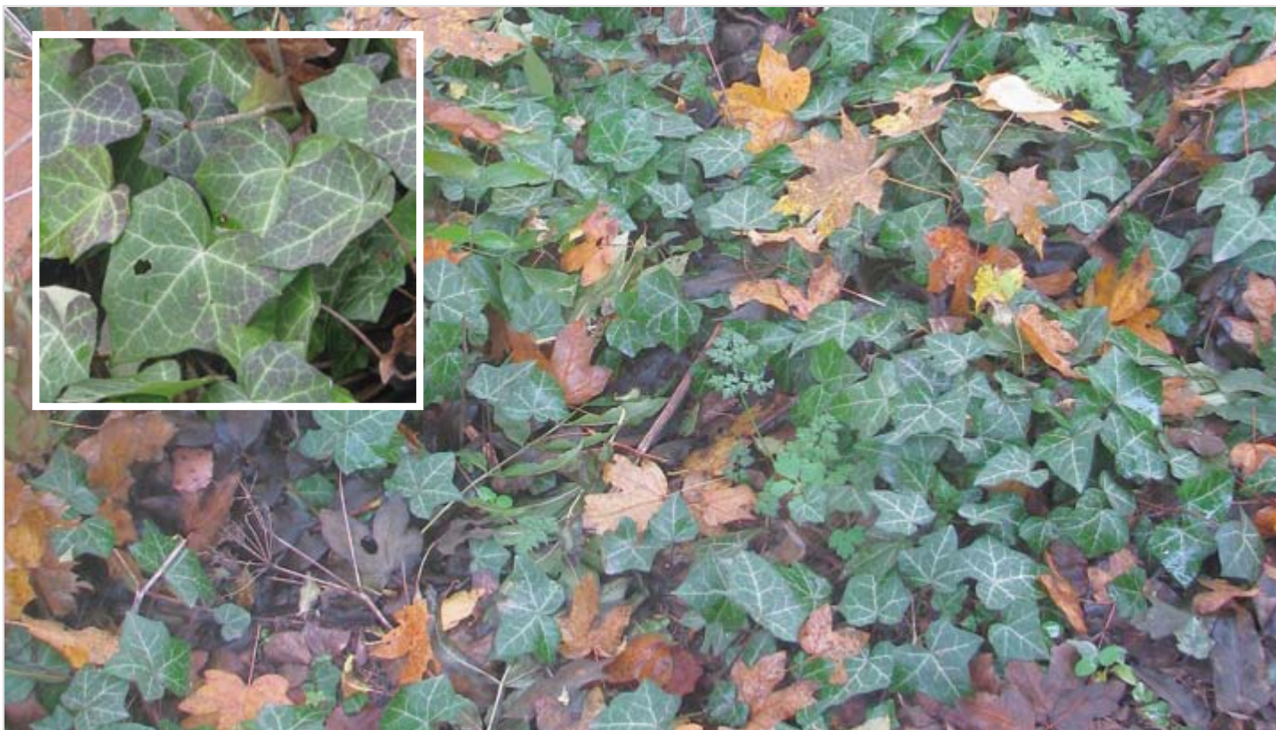
Porosty břečťanu popínavého

V bylinném podrostu lesa jsou charakterické plazivé porosty stále zeleného břečťanu popínavého ( Hedera helix ). Také v tomto lese dochází od konce března do poloviny dubna k jarnímu aspektu. Ovšem zdaleka ne v tak atraktivní míře jako v lese severně pod Andělkou. Především výskyt dymnivky duté ( Corydalis cava ) a dymnivky plné ( Corydalis solida ) zasahuje hluboko i dále do volných ploch u parku. Nejpůsobivější bývají během jarních vycházek sice ojedinělé, ale o to zahuštěnější ostrůvkovité porosty sasanky pryskyřníkovité ( Anemone ranunculoides ) a orseje jarního ( Ficaria verna ), jen vzácně objevíme nějakou sasanku hajní ( Anemone nemorosa ). V horním severozápadním cípu podél plotu sousedních zahrádek najdeme porost barvíneku menší ( Vinca minor ) a nedaleko od něj pak mohutnou košatou srstku obecnou – angrešt ( Ribes uva-crispa ).