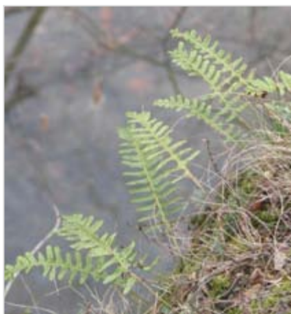
Osladič obecný Kapraď samec