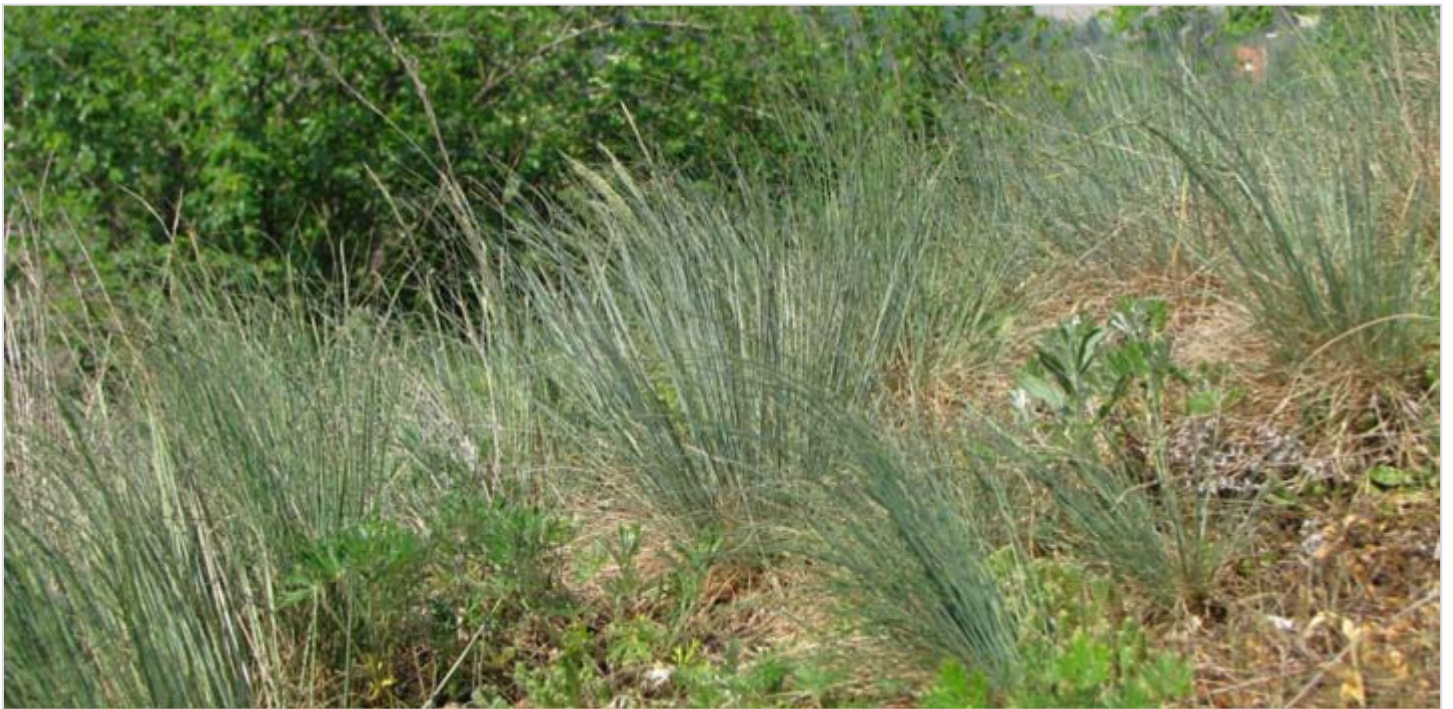
Charakteristicky ojiněné porosty kostřavy walliské

Prakticky po celý duben pak nacházíme některé druhy drobných jarních efemér. Zaujmou především bohaté porosty lomikámene trojprstého ( Saxifraga tridactylites ). V druhé polovině dubna rozkvétají pryšce chvojky ( Euphorbia cyparissias ) a pryšce mnohobarevné ( Euphorbia epithymoides ), koncem měsíce se objeví kvetoucí rožce rolní ( Cerastium arvense ).