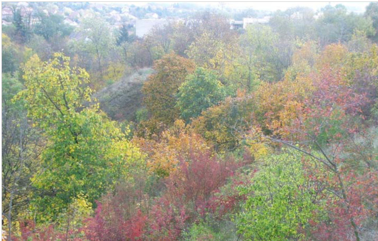
Pohled z Puštoru dolů na Andělku