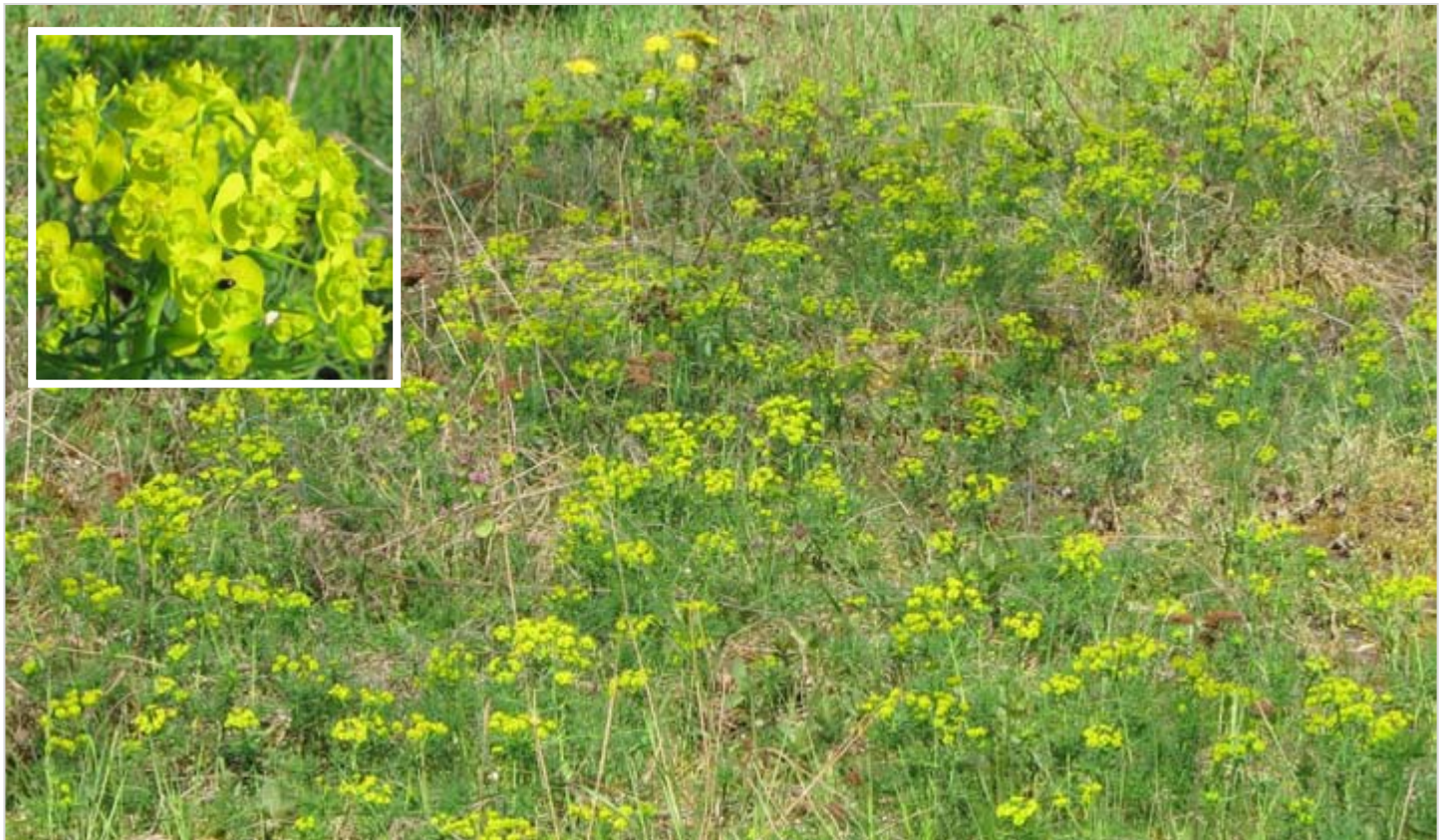
Porosty pryšce chvojky

Přesto zde můžeme dodnes každoročně sledovat rozkvět celé řady významných nebo zajímavých rostlin. Včetně ojedinělých fragmentů původní porostů kostřavy walliské ( Festuca valesiaca ). Od prvních dubnových dní rozkvétají polykormony přízemní mochny písečné ( Potentilla arenaria ). Během druhé dubnové dekády jde o drobné jarní efeméry: pochybek prodloužený ( Androsace elongata ), lomikámen trojprstý ( Saxifraga tridyctylites ) nebo rozrazil časný ( Veronica praecox ). Koncem dubna a začátkem května jsou charakteristické kvetoucí pryšce chvojky ( Euphorbia cyparissias ). Kolem poloviny května zde dodnes rozkvétá nějaký pryskyřník ilyrský ( Ranunculus illyricus ). Zhruba během druhé dekády června se objevují charakteristické porosty rozchodníku ostrého ( Sedum acre ) a šestiřadého ( Sedum sexangulare ) nebo čistce přímého ( Stachys recta ), vzácně objevíme nějakou silenku ušnici ( Silene otites ) nebo hvozdíček prorostlý ( Kohlrauschia prolifera ). Začátkem července dodávají ploše charakter kvetoucí šedivky šedé ( Berteroa incana ), česneky žluté ( Allium flavum ) nebo