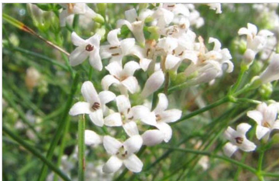
Mařinka psí ( Asperula cynanchica )