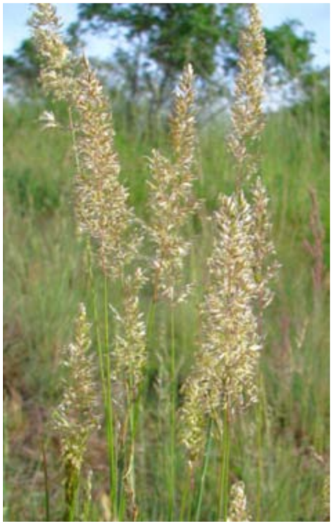
Porosty svízele sivého Kvetoucí kostřava walliská Chrpa chlumní