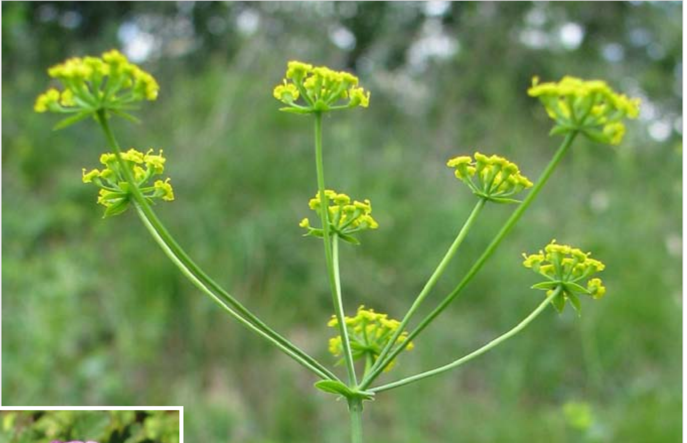
Prorostlík srpovitý ( Bupleurum falcatum )

Na Andělce a Čertovce bylo doposud nalezeno více než 250 druhů vyšších rostlin. Z toho jde ve 48 případech o druhy významné: zvláště chráněné (8) nebo ohrožené zařazené na Červeném seznamu (40).