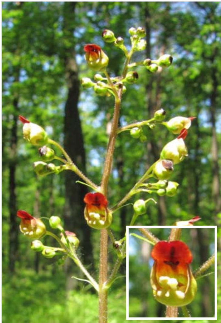
Statný krtičník křídlatý ( Scrophularia nodosa )