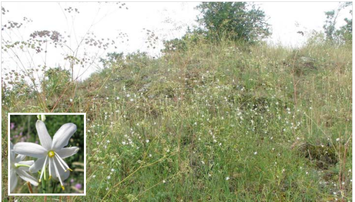
Bohaté porosty bělozářky větevnaté