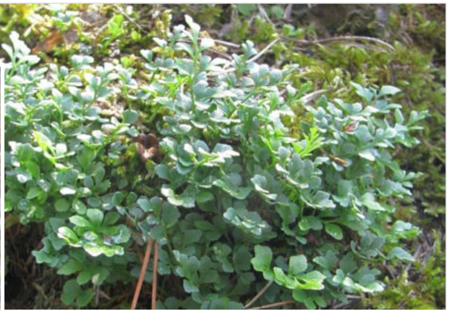
Sleziník severní (na prostředním snímku koncem zimy)