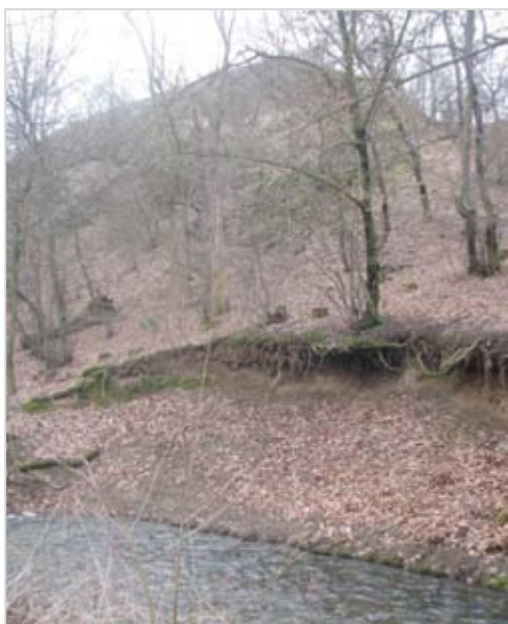
Nahoře v pozadí Andělka