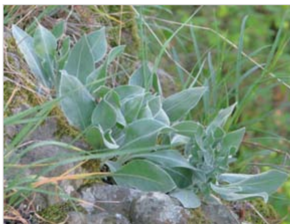
Přežívající trs teplomilné chrpy chlumní