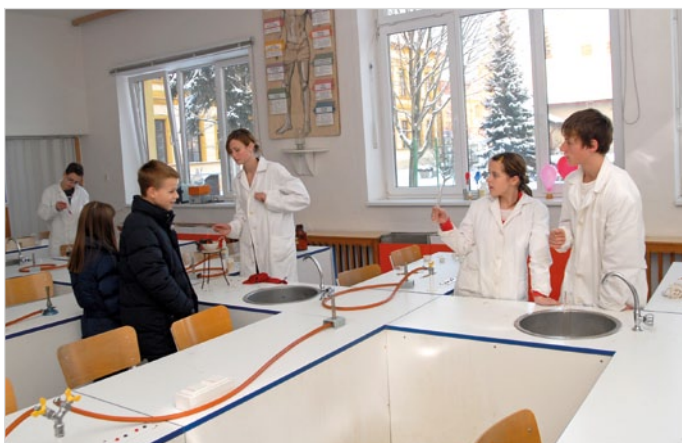
Den otevřených dveří na gymnáziu, 4. 12. 2010