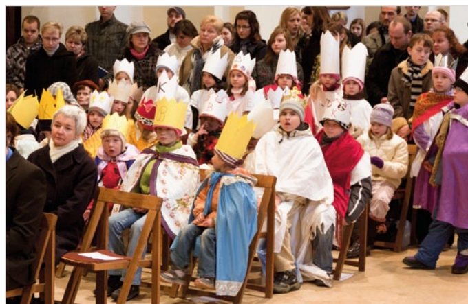
Tříkrálová sbírka, 9. 1. 2011