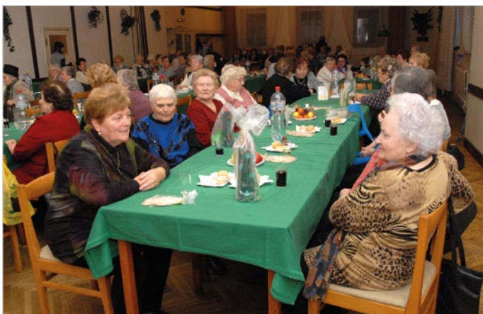
Předštědovečerní večeře pro seniory, 22. 12. 2010