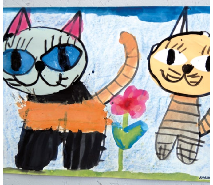
Velká výstava malých umělců v Muzeu Brněnska ve Šlapanicích.