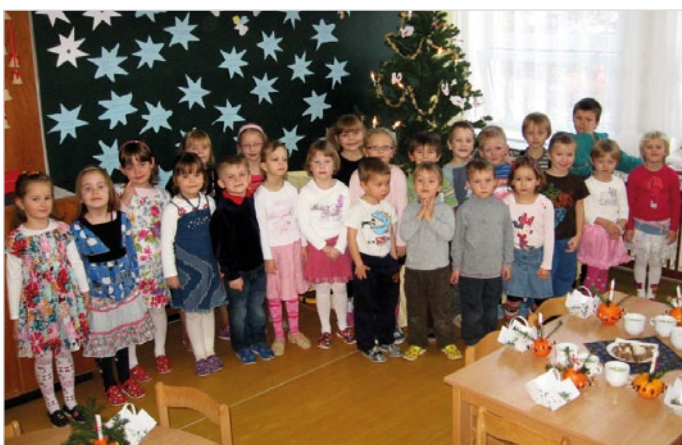
Vánoční besídka v MŠ Zahrádka, 14. 12. 2010