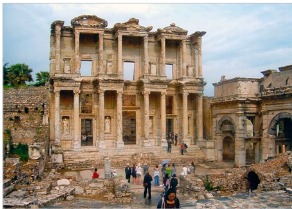
Efes – Celsova knihovna

Po příletu do Antalye nás přivítal průvodce a v krásném pětihvězdičkovém hotelu v Kemeru ještě jednou srdečně pozdravil přípitkem na uvítanou. Díky zajímavé poloze na úpatí svahů pohoří Taurus, porostlých piniemi, je okolí Kemeru jednou z nejkrásnějších oblastí Turecka . V okolí 20 km se nalevo i napravo rozkládají četné zátoky a pláže s hotely i prázdninovými kluby. Ubytování luxusní, strava (polopenze formou bohatých švédských stolů, co hrdlo ráčí) byla na nejvyšší úrovni, taktéž komfortní klimatizované autobusy přistavené na zájezdy. Spolu s dalšími účastníky jsme uskutečnili okružní cestu, označenou – „to nejlepší ze země tisíce a jedné noci“.