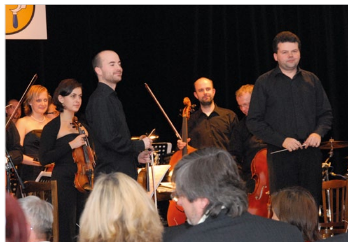
Městský ples 2011, Prestige Symphony Orchestra