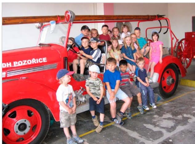
Návštěva u hasičů

malé školáčky připravují již řadu let s velkou pečlivostí, fantazií a trpělivostí mikulášskou nadílku a oslavy červnového dne dětí. Velmi si vážíme jejich pochopení a přístupu k malým dětem. Ty se tak octnou v pohádce, v cirkuse, u indiánů nebo na cestě kolem světa atd. Každý rok s netrpělivostí čekáme, co si pro nás vymyslí nového.