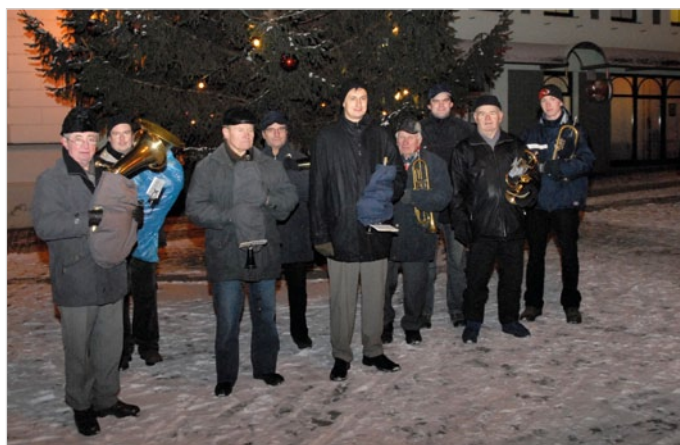
Koledy pod vánočním stromem, 29. 12. 2010