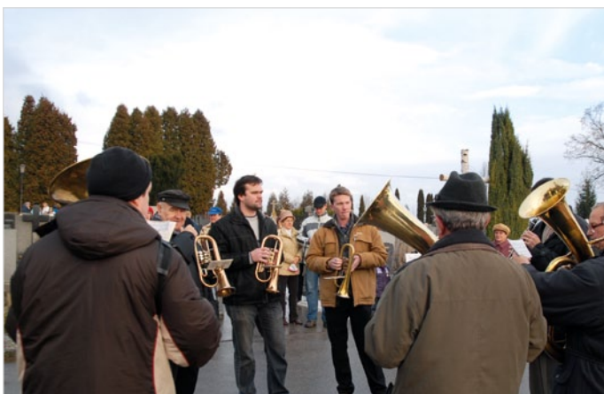
Koledy na hřbitově, 24. 12. 2010