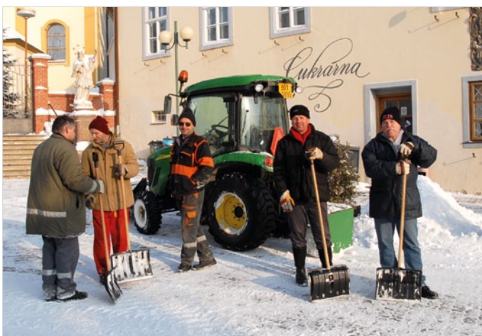
Sateso při zimní údržbě