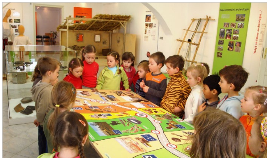
Návštěva Muzea Šlapanice

malé školáčky připravují již řadu let s velkou pečlivostí, fantazií a trpělivostí mikulášskou nadílku a oslavy červnového dne dětí. Velmi si vážíme jejich pochopení a přístupu k malým dětem. Ty se tak octnou v pohádce, v cirkuse, u indiánů nebo na cestě kolem světa atd. Každý rok s netrpělivostí čekáme, co si pro nás vymyslí nového.