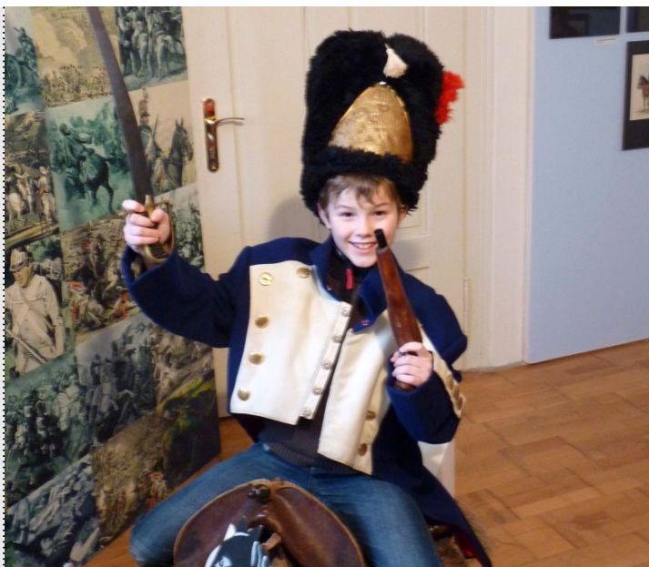
Z Napoleonské herny

Výhercům blahopřejeme, děkujeme všem za účast v soutěži a těšíme se na setkání na dalších výstavách!