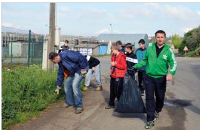
Úklid katastru, 26. 4. 2014