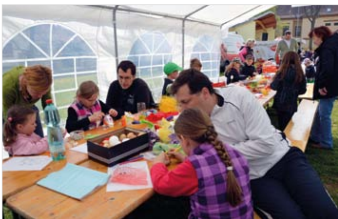
Velikonoční dílna, 19. 4. 2014