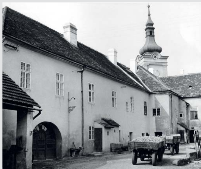
Zadní trakt budovy muzea, 60. léta 20. století

Přednáška je věnována pomníkům a památníkům na bojišti bitvy u Slavkova, včetně jejich vzniku a poslání. Ústředním tématem přednášky, doprovázené řadou vyobrazení, je příběh v evropském i světovém kontextu zcela ojedině-