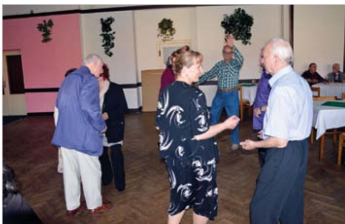
Melodie stále zelené, 24. 4. 2014