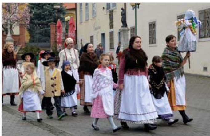
Vynášení smrtky, 6. 4. 2014