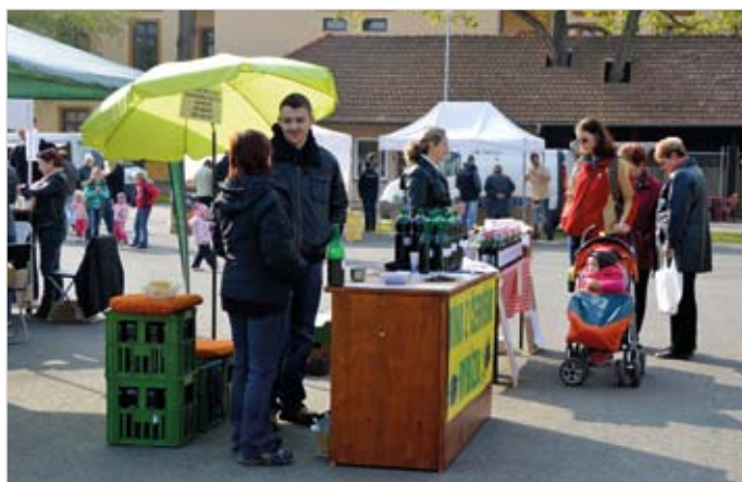
Farmářské trhy, 19. 4. 2014