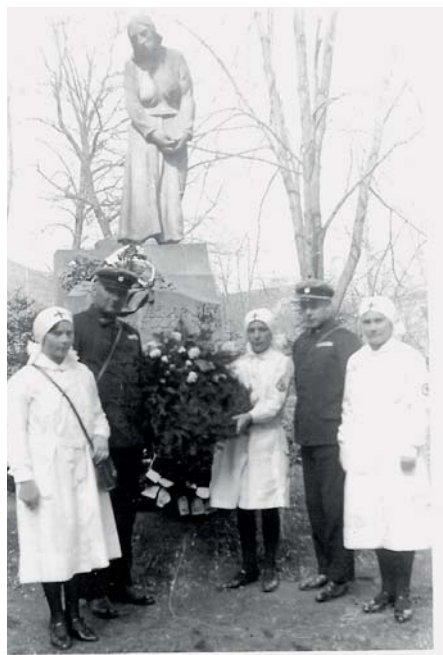
Samaritáni hasičského sboru při oslavách 28. října v první polovině 30. let 20. století

V letošním roce uplyne 100 roků od vypuknutí I. světové války (1914–18), ve své době největšího válečného konfliktu v dějinách lidstva. Jak uvádějí oficiální prameny, tato válka měla 37 milionů obětí: 16 milionů mrtvých a 21 milionů zraněných. Celkový počet mrtvých zahrnuje 9,7 milionu vojáků a 6,8 milionu civilistů. V Rakousku-Uhersku, pod něhož spadaly také naše historické země, činila populace 51,4 milionu obyvatel a celkové ztráty byly 1 567 000 osob. Z toho padlých vojáků 1 100 000 a 467 tisíc zabitých civilistů. Podrobnější statistiky pak hovoří, že jen Čechů a Slováků bylo na 330 tisíc, z toho více jak 189 tisíc Čechů, 80 tisíc Moravanů, 19 tisíc Slezanů a 40 tisíc Slováků. Vojenské archivy pak dále evidují cca 130 tisíc jmen československých legionářů, kteří bojovali v ruských, italských a francouzských legiích za samostatný Československý stát, který byl vyhlášen 28. října 1918 a v jehož čele stanul prezident-osvobo-