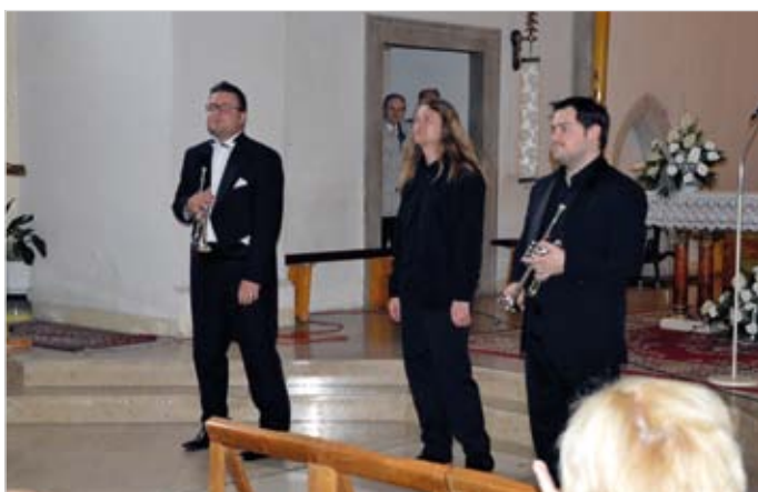
Koncert duchovní hudby, 20. 4. 2014