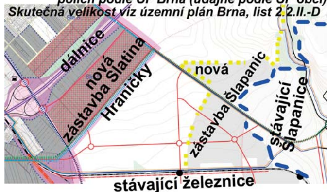
Návrh — komunikace funkční skupiny C - vybrané