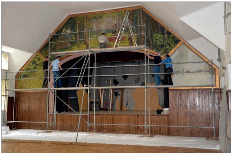
Na sokolovnu se v polovině května vrátil zrestaurovaný obraz od Aloise Kalvody.

kamarádka, začala mít starosti s láskou, do její rodiny zasáhla zákeřná nemoc a kdoví, jak přežije celé prázdniny, když jí krachly všechny plány? Ze smutku si začne psát blog, který se brzy stane víc než jen veřejným deníčkem, protože její zápisky si čtou kromě jejích vrstevníků i zkušení odborníci a formou diskuzních příspěvků podporují Kiki v situacích, se kterými se sama nedokáže vyrovnat.