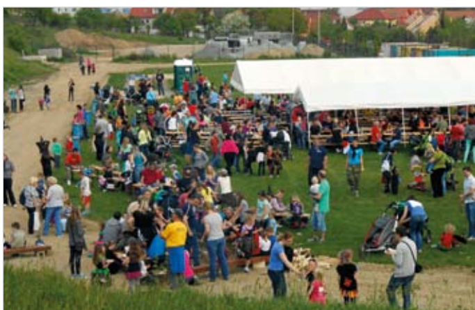
Pálení čarodějnic, 30. 4. 2014