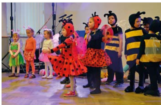
Den matek, 11. 5. 2014