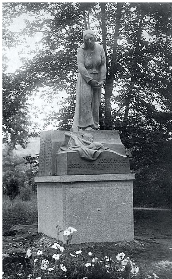
Foto dokončeného pomníku r. 1924