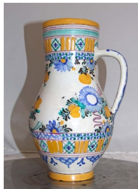
Džbán po restaurování