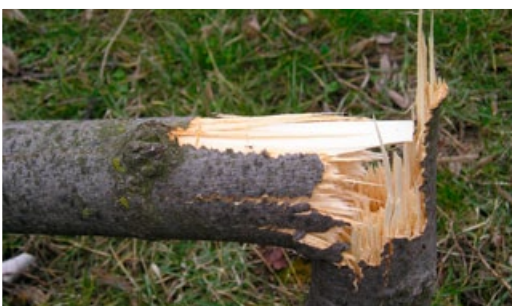
Zničená lípa na Svatojanském náměstí, 25. 3. 2008