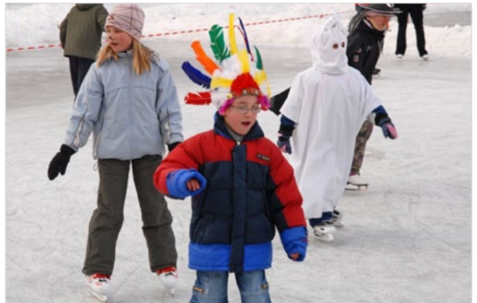
Karneval na ledě, 7. 2. 2010