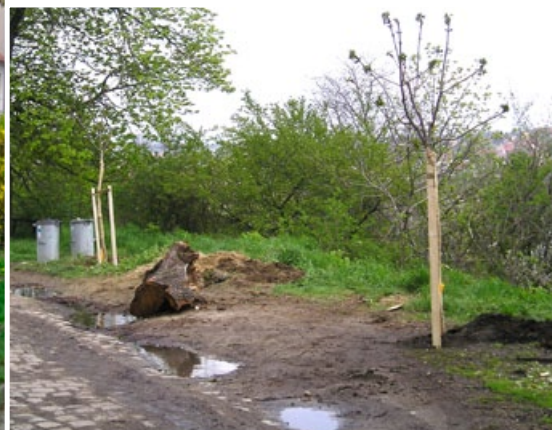
Nové kaštiny u nádraží, 22. 4. 2008