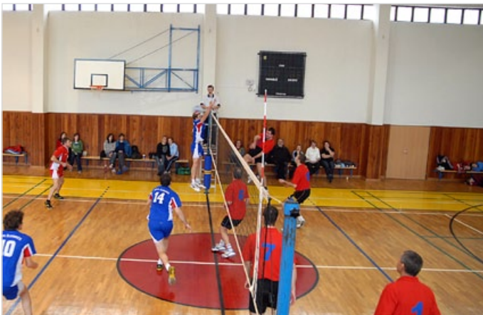
Volejbal TJ Sokol Šlapanice, 20. 2. 2010