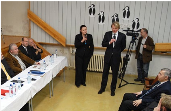
Seminář o průmyslové zóně, 26. 1. 2010