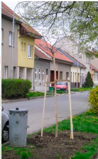
Nová lípa na Nádražní ulici, 22. 4. 2008