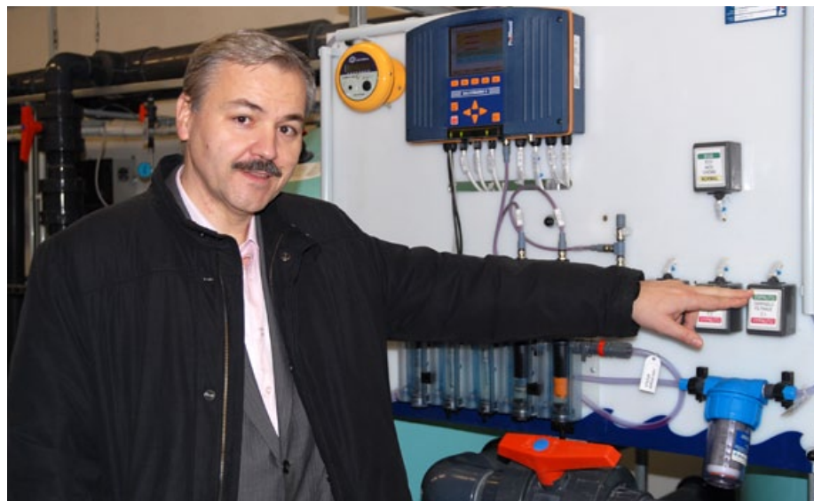
Historicky významný okamžik prvního napuštění nově zrekonstruovaného bazénu