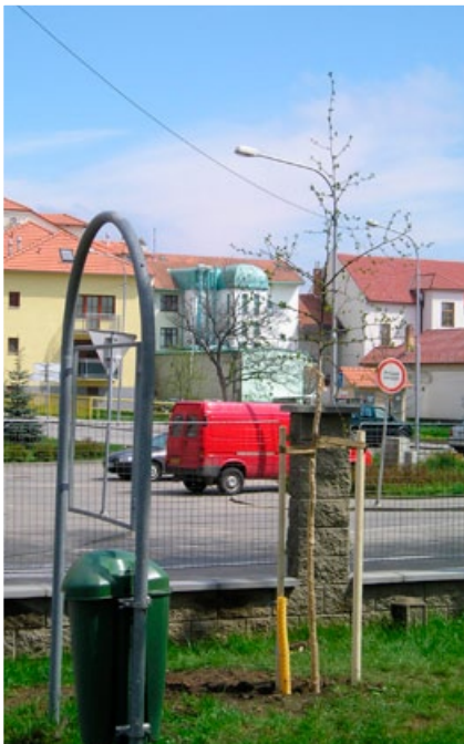
Nová bříza v městském parku, 22. 4. 2008

Město vyzývá firmy, které při provádění rekonstrukcí plynových a elektrických přípojek způsobily škody na chodnících a komunikacích, k nápravě. Prosíme tedy občany, u jejichž domu je chodník nebo komunikace poškozena, o strpení. Vedení města bude škody reklamovat. MČ