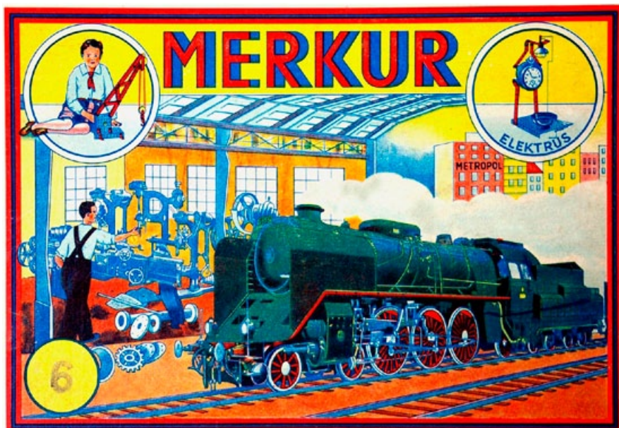
Stavebnice Merkur, 1949