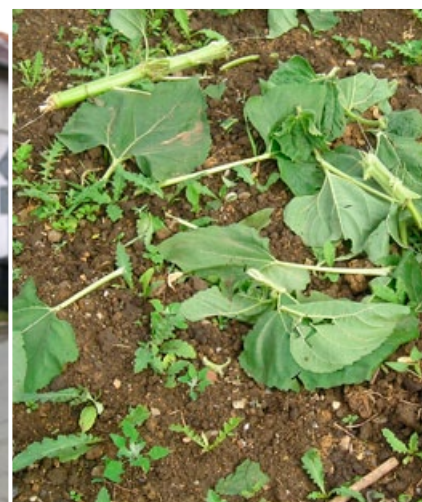
Jak dopadla slunečnice na Dlouhé ulici, 6. 7. 2009