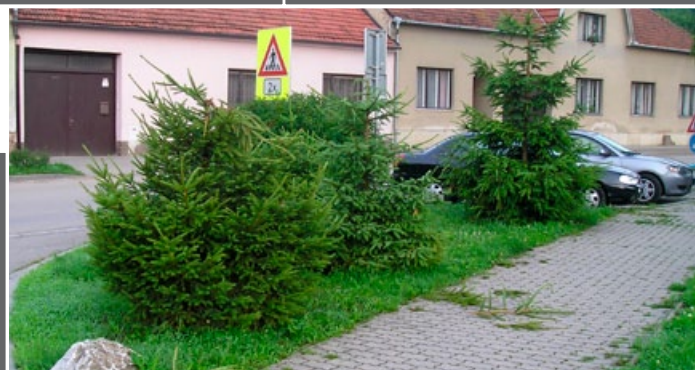
Zničené smrčky na Riegrově ulici u autobusového nádr., 29. 6. 2009