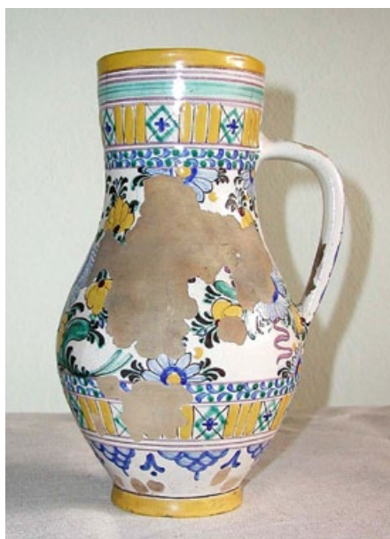
Džbán před restaurováním

Muzeum ve Šlapanicích, Masarykovo nám. 18, Šlapanice, www.muzeumbrnenska.cz , tel.: 544 228 029.