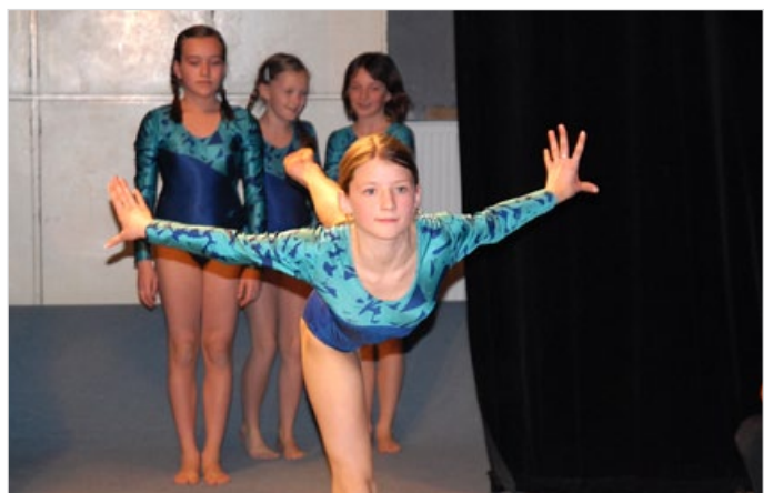
Sokolská Akademie, 28. 3. 2010