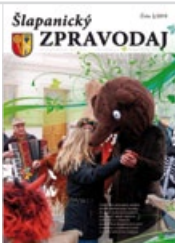
Foto na obálce: tradiční průvod maškar, Šlapanice, 14. 2. 2010