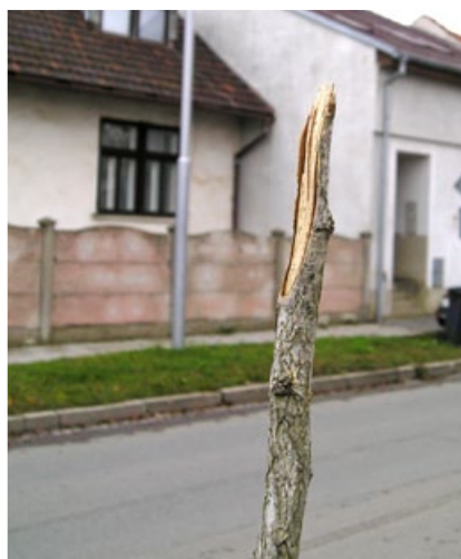
Zničená turecká líska na Nádražní ulici, 9. 11. 2009