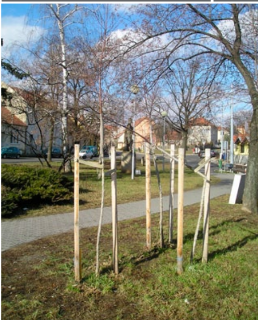
Nové břízy na Čechově ulici, 6. 2. 2009