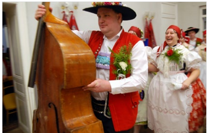
Ostatky, 13. 2. 2010