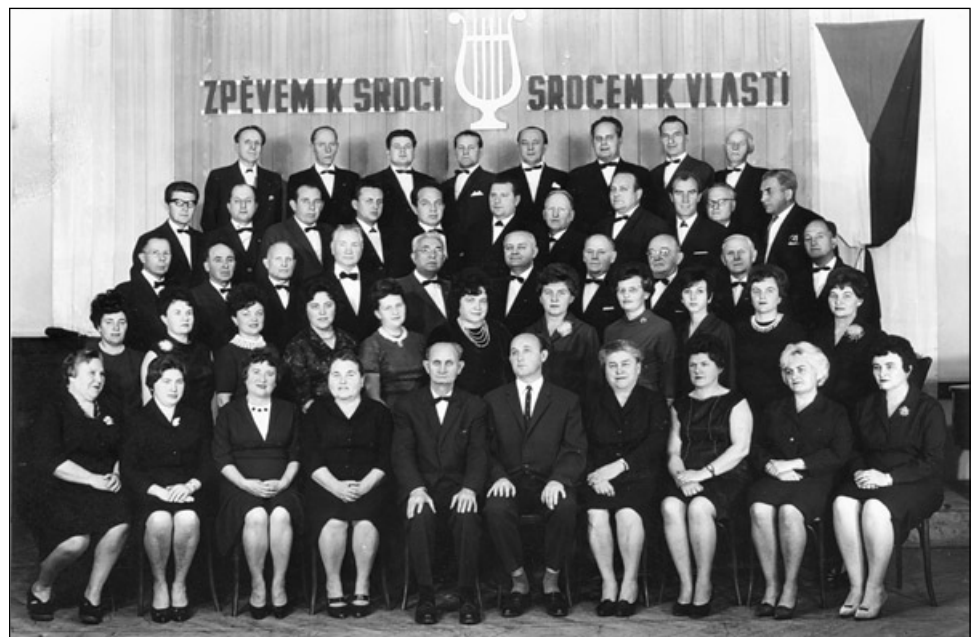
Rok 1967 – 35leté trvání PSŠ.