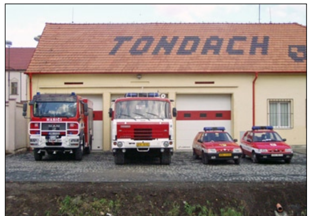
Hasičská zbrojnice 6. 12. 2008.