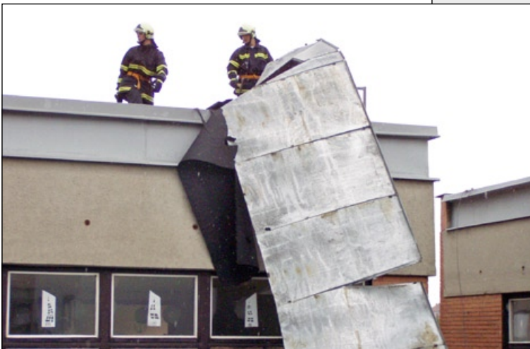
Likvidace škod na střeše ZŠ po větrné smršti 24. 6. 2008.