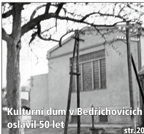
Kulturní dům v Bedřichovicích oslavil 50 let