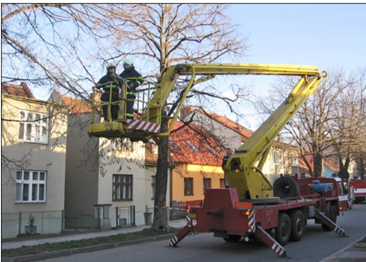
Likvidace škod po větrné smršti 7. 3. 2008.

Vedení města děkuje všem, kteří přiložili ruku k dílu při zřízení a provozu kluziště v městském parku. Děkujeme žákům ZŠ, kteří spolu s pedagogy připravili plochu, pedagogům, kteří částečně drželi dozor nad bruslením, a zvláště pak našim hasičům, strážníkům městské policie a pracovníkům firmy SATESO, kteří se mnohdy v nočních hodinách starali o údržbu ledové plochy a drželi stálou pořadatelskou službu.