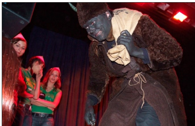
Mikulášský maškarní rej na sokolovně, 6. 12. 2008