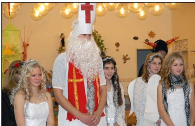
Mikuláš v MŠ Hvězdička, 5. 12. 2008.