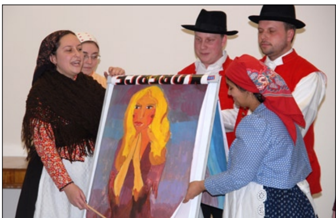
Vrčka – Od Vánoc po svatou Dorotu, 4. 1. 2009.