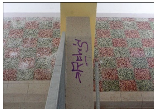
Budova MŠ Zahrádka