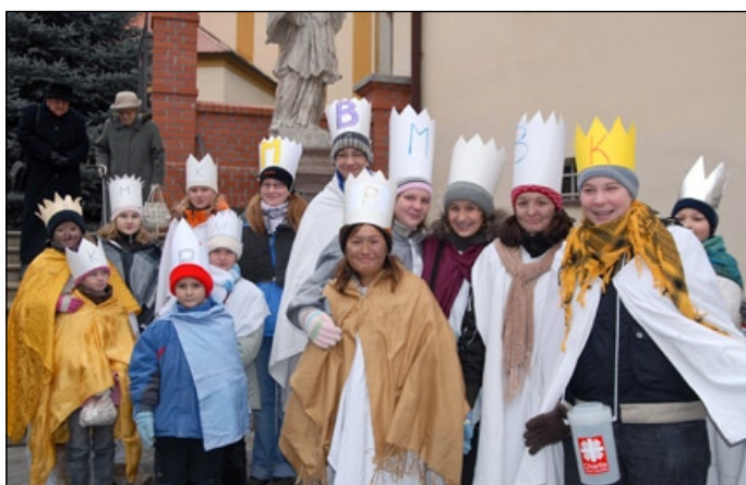
Tříkrálová sbírka, 4. 1. 2009.