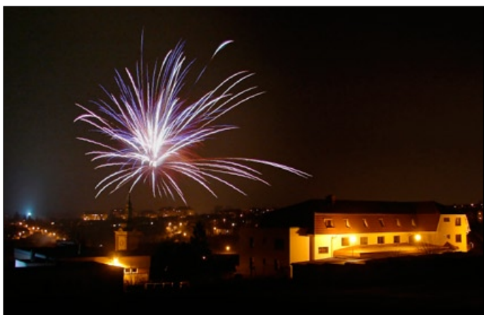
Ohňostroj, 31. 12. 2008