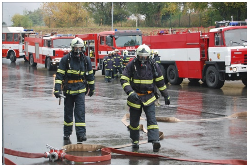
Námětové cvičení v Brně-Slatině 3. 10. 2008.