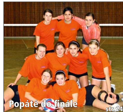
Popáté do finále