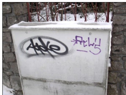
Roh ulic Boženy Němcové a Bezručovy