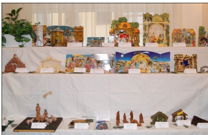
Výstava betlémů, 14. 12. 2008.