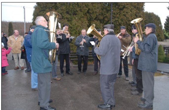
Vánoční koledování na hřbitově, 24. 12. 2008.